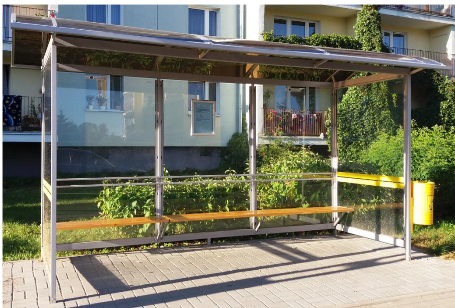
Przykładowa wiata przystankowa